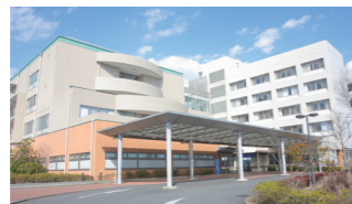
海老名総合病院 〒243-0433 神奈川県海老名市河原口 1320 http://ebina.jinai.jp/