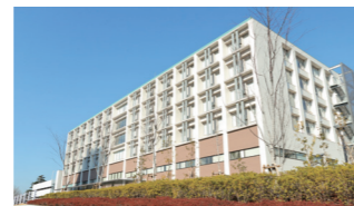
座間総合病院 〒252-0011 神奈川県座間市相武台 1-50-1 https://zama.jinai.jp/