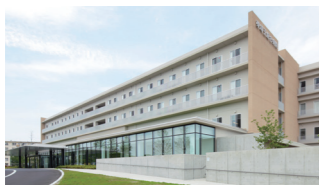
東埼玉総合病院 〒340-0153 埼玉県幸手市吉野 517-5 http://saitama.jinai.jp/

社会医療法人ジャパンメディカルアライアンスは、主に急性期を担う東埼玉総合病院、高度急性期・急性期に対応する海老名総合病院、急性期・回復期・慢性期に対応する座間総合病院、さらにJMAグループとして急性期・回復期医療で地域に貢献している医療法人社団静岡メディカルアライアンス 下田メディカルセンターの4病院を中心に、介護・福祉施設を運営。地域でシームレスな医療サービスを提供している。