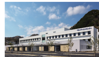
下田メディカルセンター 〒415-0026 静岡県下田市 6-4-10 http://shimoda.s-m-a.or.jp/