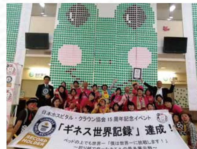
3542匹の折り紙のカエル

ホスピタル・クラウンとは、クラウン(道化師)が小児病棟を訪問し、つらい入院生活を送る中で本来の子どもらしさを失いがちになっている子ども達に笑顔を届け、キラキラした瞳を取り戻すことを目的とした活動のことです。海老名総合病院では、日本ホスピタル・クラウン協会の活動に共感し、7年前から小児病棟に月2回のペースで訪問をお願いしています。