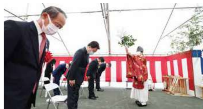
内野市長もご参列くださいました

「JMAグループTOPICS」では、グループ内におけるイベントや取り組み・ニュースなどをご紹介します。