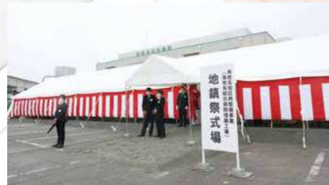
当日はあいにくの雨模様