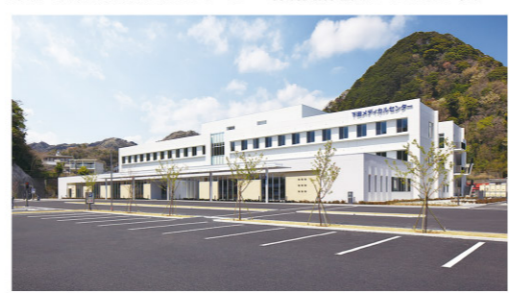
下田メディカルセンター