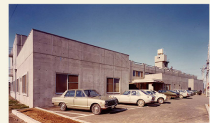
東埼玉病院 開院当時の外観

1999年1月(平成11年) ・老人保健施設アゼリア(現・介護老人保健施設アゼリア)開設