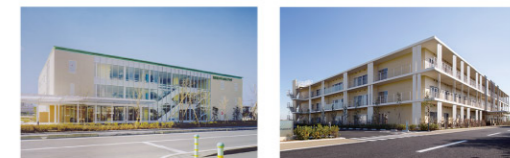
海老名メディカルプラザ 特別養護老人ホーム 陽だまり