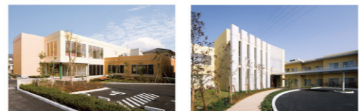
東埼玉総合病院附属 清地クリニック 特別養護老人ホーム はなみずき