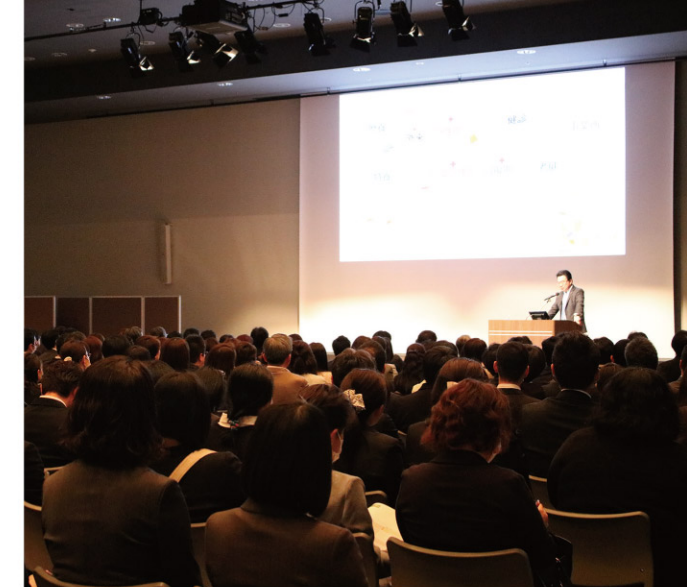
2018年3月 JMAグループ中期事業計画発表会

個人や施設、法人の枠を超え、各々の力を最大限に発揮し、地域のニーズに応え得る存在でありたいと思います。