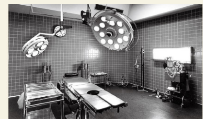
東埼玉病院 開院当時の手術室

2002年4月(平成14年) ・海老名総合病院附属東病院を東日本循環器病院に名称変更