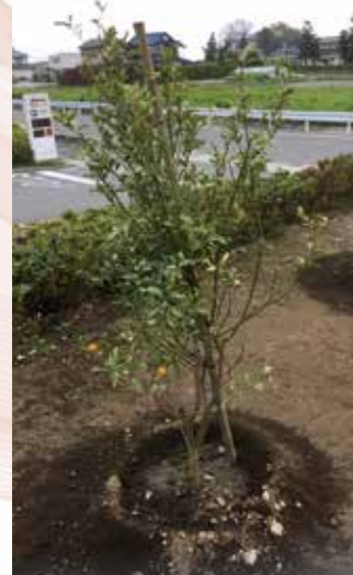
小さな実をつけるきんかんの木

東埼玉総合病院では、これまで新型コロナウイルス感染拡大防止のため、職員の体調管理の徹底や入院患者様への面会や付添の制限など、さまざまな対策を行ってきました。