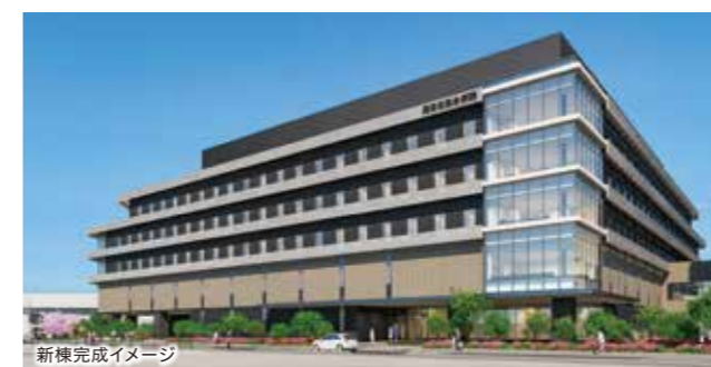
新棟完成イメージ

ルプラザの外来診療は通常通り行われます。「本館」内の診察室、検査室などが随時移動されることもありますので、ご理解とご協力をお願いいたします。