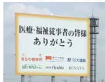
東埼玉総合病院駐車場の横に立てられた看板

また、今だからこそ改めて痛感するできごとがありました。東埼玉総合病院の目の前に立てられた、大きな看板。厳しい局面が続く病院職員にとって、地域の方々からの温かいご支援・ご協力が何よりの励みとなります。その想いへの感謝の気持ちを忘れず、今後とも医療従事者としての責務を果たしてまいります。